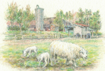
① 広島市青少年センター こども村 牧場