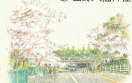
春 安佐動物公園前 通りの桜並木