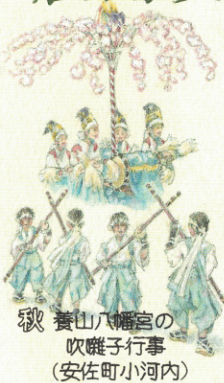
秋 養山八幡宮の 吹雛子行事 (安佐町小河内)